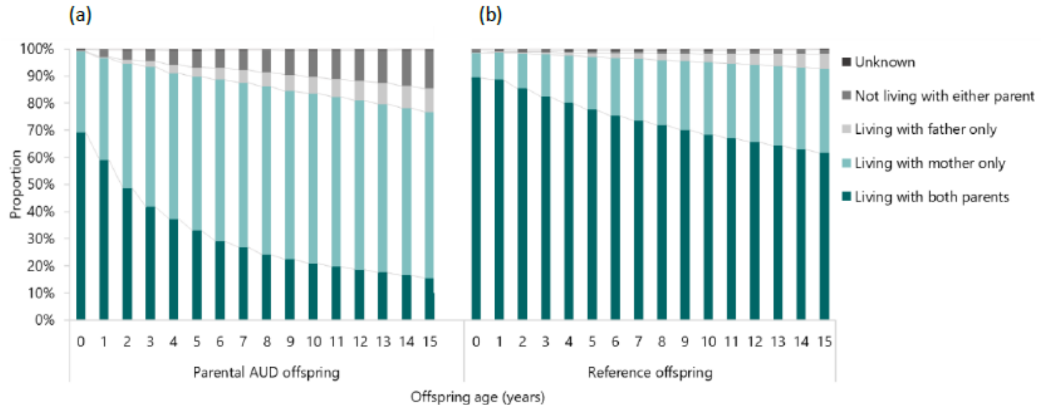
Figure 1. Family structure during upbringing among (a) offspring with parental AUD (b) reference offspring 1