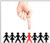
Stigmatisering og fordomme